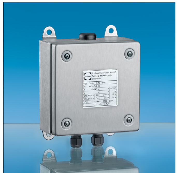
Lumistar Timer, Ausführung in Edelstahl