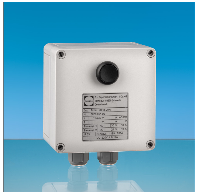
Lumistar Timer im Kunststoffgehäuse