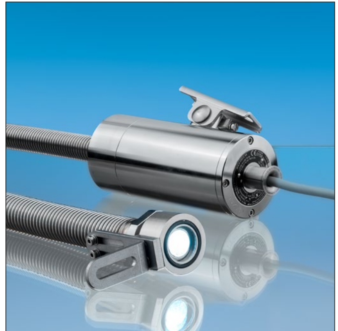
Lumistar Leuchte 'Lumiflex' ESL55LED-ALF-Ex